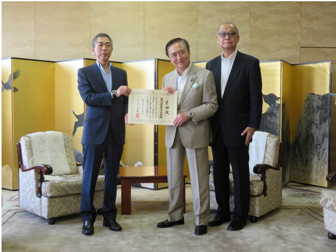
左から小林副理事長、黒岩神奈川県知事、佐藤信晶神奈川県遊技場協同組合専務理事